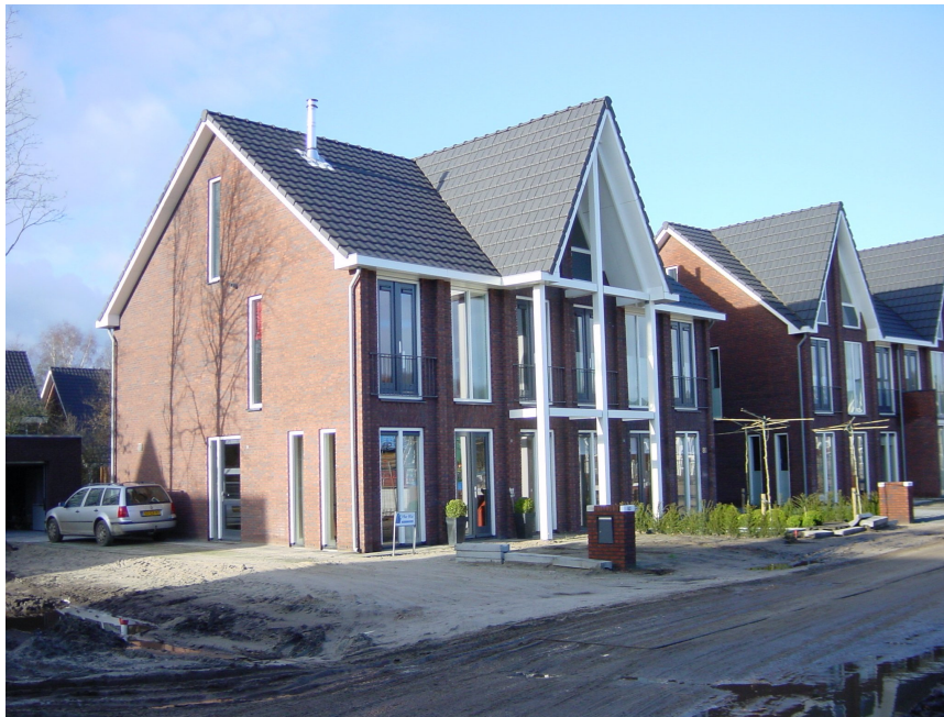
Woningen in de nieuwbouwwijk De Bunte, die in 2007 gereed kwamen.