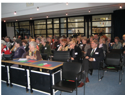
regionale vergadering 11 december 2007

De VAC' s betrokken bij de Stedendriehoek hebben dit jaar een bijeenkomst gehouden met als doel in de toekomst meer te gaan samenwerken. Hieruit zijn enkele activiteiten voortgekomen o.a. een gezamenlijk bezoek aan BAM woningbouw te Deventer; een werkgroep om mogelijk meer eenheid te verkrijgen in VAC adviezen.